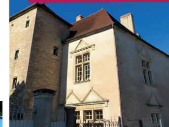
Maison CHATEAUROULLAUD (XV e et XVI e siècles)

Entre les deux anciens pavillons d'entrée, vous arrivez dans ce qui était la cour du château, cour fermée autrefois par une grande et belle grille en fer forgé. À gauche, vous apercevez la partie restante du château. Devant et à droite, une construction basse : des salles voûtées , qui servent aujourd'hui de lieu d'expositions.