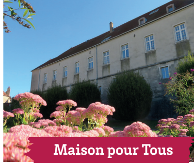
Maison pour Tous

Durée 1 h 30 Tarif : 3,50 € par personne