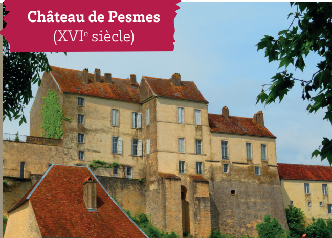
Château de Pesmes (XVI e siècle)

Entre les deux anciens pavillons d'entrée, vous arrivez dans ce qui était la cour du château, cour fermée autrefois par une grande et belle grille en fer forgé. À gauche, vous apercevez la partie restante du château. Devant et à droite, une construction basse : des salles voûtées , qui servent aujourd'hui de lieu d'expositions.