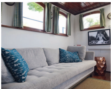
Un salon confortable