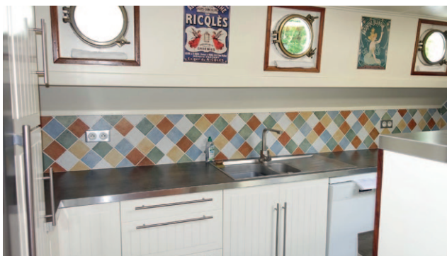
Cuisine équipée : Cuisinière Lacanche, lave-vaisselle, micro-onde, réfrigérateur, congélateur, ensemble de vaisselle complet.