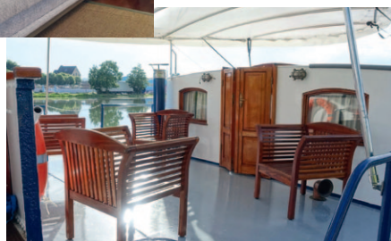
Un salon extérieur en teck