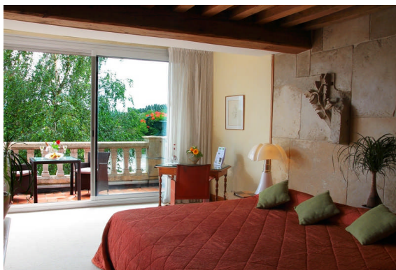
L'une de nos 32 chambres avec ou sans vue sur la rivière