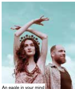
An eagle in your mind