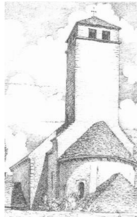
Dessin de Michel Bouillot, Carte postale Association de sauvegarde et de mise en valeur de Saint-Clément-sur-Guye